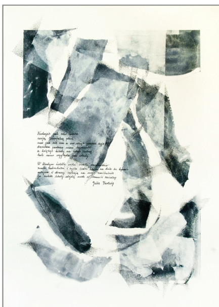
Praca do wiersza Słuchajcie jak echo śpiewa z tomiku Zapiscane J. Hartwig 50x70 cm, kolaż, technika mieszana, 2018

Na okładce prace inspirowane wierszami A. Sołtysik, od góry: Ćmy 1, Ćmy 2, Ćmy 3 100x70 cm, technika mieszana, 2019