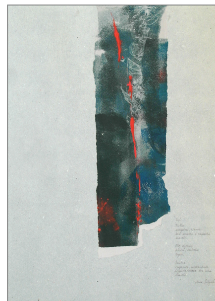
Praca do wiersza (...) Anny Sołtysik 50x70 cm, kolaż, monotypia, 2018

Na okładce prace inspirowane wierszami A. Sołtysik, od góry: Ćmy 1, Ćmy 2, Ćmy 3 100x70 cm, technika mieszana, 2019