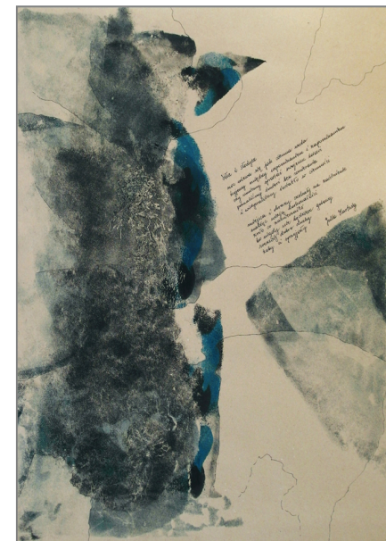
Praca do opowiadania Sila i słodycz z tomiku Zapiscane Julii Hartwig 50x70 cm, technika mieszana, 2018