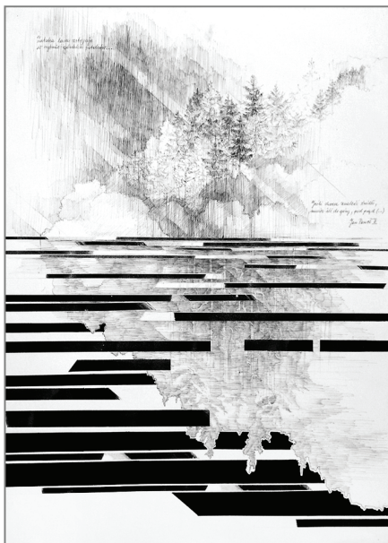
Praca do wiersza Źródło z Trypnyku Rzymskiego Jana Pawła II 50x70 cm, kolaż, technika mieszana, 2018